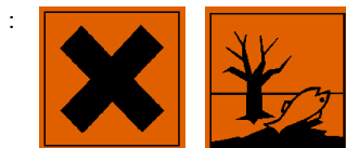
Xi - Irriterend